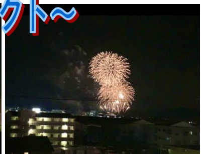
東広島市消防署横