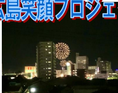
東広島市立中央中学校