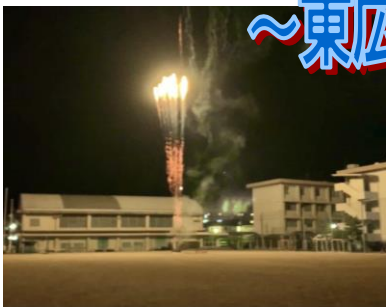
広島県立賀茂高校