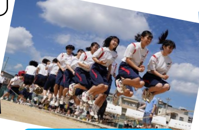
クラスでジャンプ