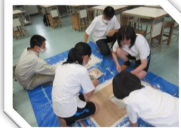
美術部の生徒が得点板を作りました