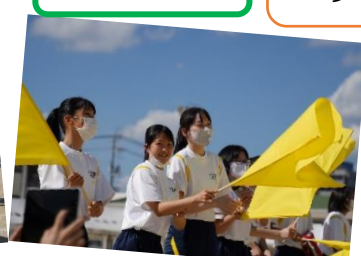
学年ごとに旗を振って応援しました