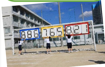
ハンドボール部、バスケットボール部の生徒が得点係をしました