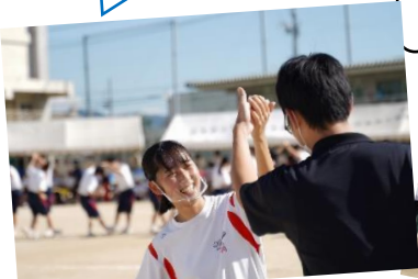
フォークダンス(3年生)

天候が悪くても何とか全種目を行い、3年生には最後のフォークダンスを踊ってもらいたい、という気持ちで、生徒会執行部を中心に全員が協力して体育祭を行いました。今年は学年対抗で競技を行い、3年生が優勝しました。無観客で行ったため、保護者の方には撮影した動画を後日、YouTubeで見てもらうようにしました。